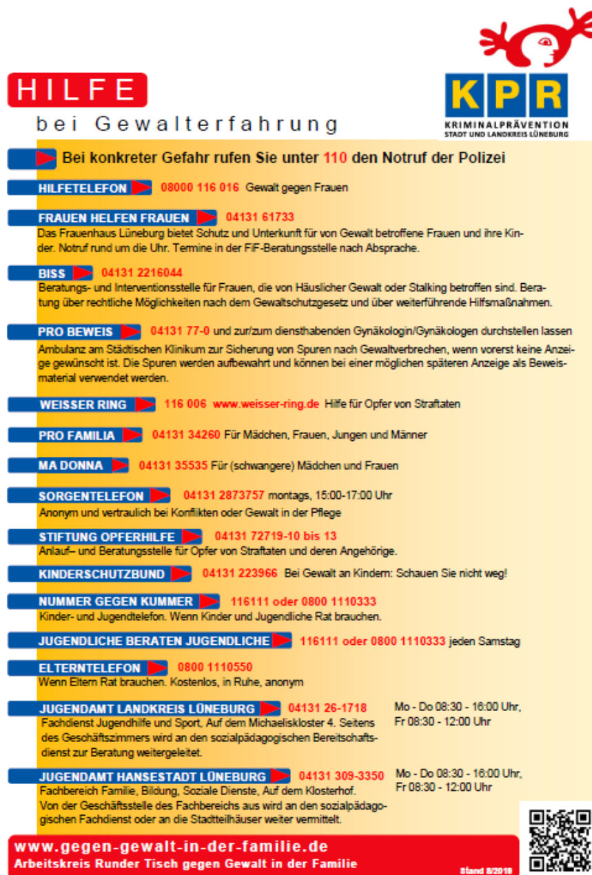
Abb 3: Beispiel einer Kontaktliste des Arbeitskreises „Runder Tisch gegen Gewalt in der Familie“ verfügbar unter https://gegen-gewalt-in-der-familie.de/ [01.04.2023]

Nehmen Sie die Beratungsmöglichkeit mit der „ insoweit erfahrenen Fachkraft “ in Anspruch, die Sie bei der Einschätzung der Gefährdungslage auch bei pseudonymisierten Fällen unterstützt und mit Ihnen die weiteren Handlungsoptionen erarbeitet. Auch die Erziehungsberatungsstellen können von Fachkräften in Anspruch genommen werden. Greifen Sie dabei auf Ihre regionalen Beratungsangebote und auf Ihr Netzwerk zurück. Vielleicht gibt es eine entsprechende Kontaktliste, wie jene des Arbeitskreises „Runder Tisch gegen Gewalt in der Familie“ von Stadt und Landkreis Lüneburg in ihrer Einrichtung, oder Sie nutzen unsere Vorlage im Anhang, um eine entsprechende Sammlung anzulegen.