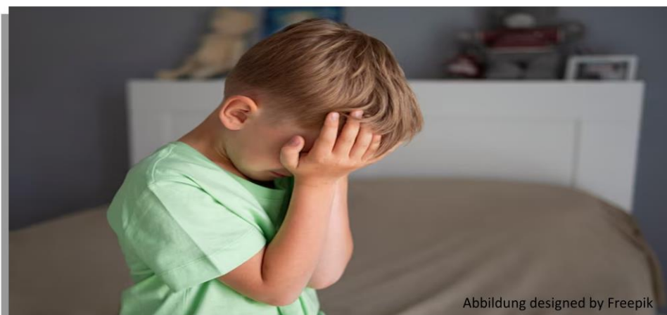
Abbildung designed by Freepik